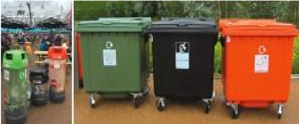
ಬೀದಿ ಹಂತದಲ್ಲಿ ಮಾಧ್ಯಮಿಕ ಕಸ ಸಂಗ್ರಹಣೆಗೆ ಬಣ್ಣದ ಸಂಕೇತವನ್ನೊಳಗೊಂಡ ಕಸದ ಬುಟ್ಟಿಗಳು

ಇದು ಕೇವಲ MoEF ನಿಯಮಗಳ ಉಲ್ಲಂಘನೆ ಮಾತ್ರವಲ್ಲ. ಅಂದರೆ, ಮಾಧ್ಯಮಿಕ ಶೇಕರಣೆಗೆ, ಅದರಲ್ಲೂ ವಿಶೇಷವಾಗಿ ಮಾರುಕಟ್ಟೆ ಪ್ರದೇಶಗಳಲ್ಲಿ ಕಂಟೈನರ್‌ಗಳು/ನೈರ್ಮಲ್ಯ ಬುಟ್ಟಿಗಳನ್ನು ಇಡದಿದ್ದರೆ, ಅದನ್ನು ವಾಸ್ತವದಲ್ಲಿ ಪರಿಣಾಮಕಾರಿಯಾಗಿ ನಿರ್ವಹಣೆ ಮಾಡಲು ಆಗುವುದಿಲ್ಲ. ಸಿಮೆಂಟ್ ಜಗುಲಿಯ ಮೇಲೆ ಇಡಬಹುದಾದ ಸುಂದರವಾಗಿ ಕಾಣುವ ಫೈಬರ್ ಬುಟ್ಟಿಗಳು (ಚಿತ್ರವನ್ನು ಕೆಳಗೆ ಲಗತ್ತಿಸಿದೆ) ಲಭ್ಯವಿದ್ದು, ಅವುಗಳ ಸರಿಯಾದ ಬಳಕೆ ಬಗ್ಗೆ ಜನರಿಗೆ ತಿಳುವಳಿಕೆ ನೀಡಬೇಕಿದೆ. ಬಣ್ಣದ ಸಂಕೇತಗಳಿರುವ ಡಬ್ಬಿಗಳನ್ನು ಸಂಸ್ಕರಣೆ ಮಾಡುವ ಸ್ಥಳಕ್ಕೆ ತಳ್ಳಿಕೊಂಡು ಹೋಗಬಹುದು ಅಥವಾ ತಾಂತ್ರಿಕವಾಗಿ ಎತ್ತಿಕೊಂಡು ಹೋಗಿ ಕಾಂಪ್ಯಾಕ್ಟರ್‌ಗಳ ಮೂಲಕ ಖಾಲಿ ಮಾಡಬಹುದು ಮತ್ತು ಕೈಯಿಂದ ನಿರ್ವಹಿಸುವುದನ್ನು ತಡೆಯಬಹುದು.