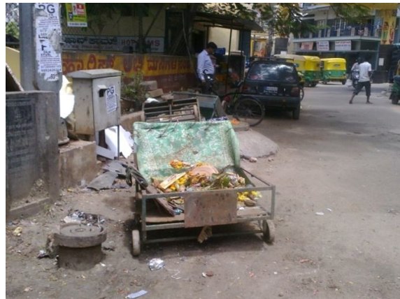
ಪರಿಸರಕ್ಕೆ ಹೊರಚಾಚಿದ ಸಂಗ್ರಹಿಸಿದ ತ್ಯಾಜ್ಯ