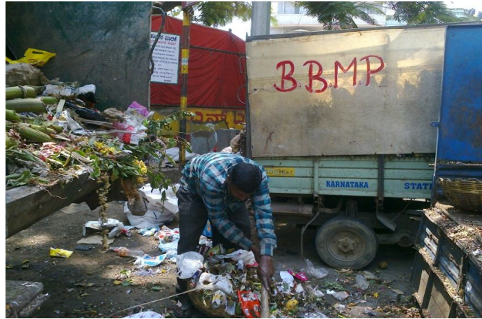
ಕೈಯಿಂದಲೇ ಕಸವನ್ನು ಎತ್ತುತ್ತಿರುವುದು