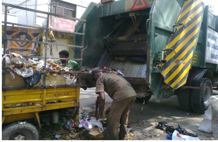
ಕಸವನ್ನು ಕೈಯಿಂದಲೇ ನಿರ್ವಹಿಸುತ್ತಿರುವುದು.