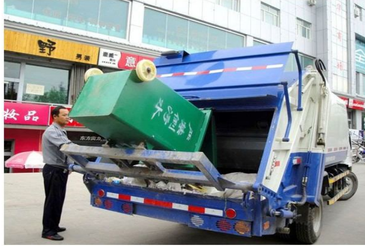
ಬೀದಿ ಬದಿಯ ಕಸದ ಬುಟ್ಟಿಯನ್ನು ತಾಂತ್ರಿಕವಾಗಿ ಖಾಲಿ ಮಾಡುತ್ತಿರುವ ಕಾಂಪ್ಯಾಕ್ಟರ್