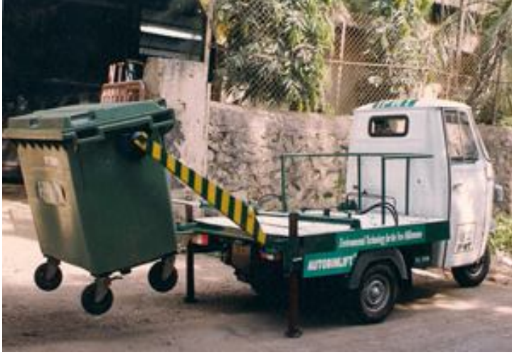
ಗೃಹಬಳಕೆ ತ್ಯಾಜ್ಯವನ್ನು ಸಂಗ್ರಹಿಸಲು ಇರುವ, ಮುಚ್ಚಳ ಸಹಿತ ಕಂಟೈನರ್ ಒಳಗೊಂಡ ಆಟೋ

ಖಾತರಿಪಡಿಸಬೇಕು. ಅಂದರೆ ಪರಿಸರಕ್ಕೆ ಹೊರಚಲ್ಲದಂತೆ ನೋಡಿಕೊಳ್ಳಬೇಕು ಅಥವಾ ಸಾರ್ವಜನಿಕವಾಗಿ ಕಾಣಬಾರದು ಮತ್ತು ದುರ್ವಾಸನೆ, ರೋಗವಾಹಕಗಳು, ನೋಣಗಳು, ಸೊಳ್ಳೆಗಳು, ಇಲಿಹೆಗ್ಗಣಗಳು, ಬೀದಿ ಪ್ರಾಣಿಗಳಿಗೆ ಇತ್ಯಾದಿಗಳಿಗೆ ಕಾರಣವಾಗಬಾರದು ಮತ್ತು ಕೆಲಸಗಾರರಿಗೆ ಹಾಗೂ ನಾಗರಿಕರಿಗೆ ಅಪಾಯವನ್ನುಂಟು ಮಾಡಬಾರದು. (ಆ ರೀತಿಯ ಮುಚ್ಚಳ ಸಹಿತ ಕಂಟೈನರ್‌ಗಳನ್ನು ಒಳಗೊಂಡ ವಾಹನಗಳ ಚಿತ್ರಗಳನ್ನು ಈ ಕೆಳಗೆ ಲಗತ್ತಿಸಿದೆ)