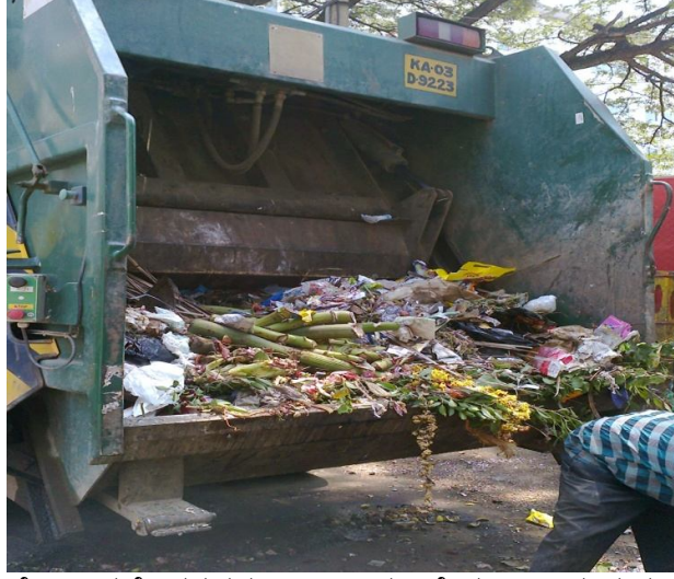
ಕೈಯಿಂದಲೇ ಕಸವನ್ನು ಕಾಂಪ್ಯಾಕ್ಟರ್‌ಗೆ ತುಂಬುತ್ತಿರುವುದು

ದ್ವಿತೀಯ/ಮಾಧ್ಯಮಿಕ ತ್ಯಾಜ್ಯ ಕಂಟೈನರ್ ಇಲ್ಲದೆ, ಅದೇ ಸ್ಥಿತಿ ಮುಂದುವರಿಸುವ ಸಾಧ್ಯವಿದೆ.