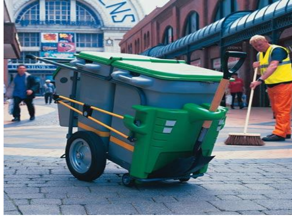
ಬೀದಿ ಕಸ ಸಂಗ್ರಹಣೆಗಿರುವ ಮುಚ್ಚಳ ಸಹಿತ ಬಹು ಡಬ್ಬಿಗಳನ್ನೊಳಗೊಂಡ ಟ್ರಾಲಿ

ನಿಯಮಗಳಲ್ಲಿ ಉಲ್ಲೇಖಿಸಿದ ನಿಬಂಧನೆಗಳನ್ನು ಪೂರೈಸಬೇಕು, ಅಂದರೆ ಮೂಲಸೌಕರ್ಯಗಳಲ್ಲಿ ತಳ್ಳುಗಾಡಿಗಳು/ಮೂರುಚಕ್ರದ ಗಾಡಿ[ಸೈಕಲ್]ಗಳು/ ಮುಚ್ಚಳವಿರುವ ಟ್ರಾಲಿಗಳು, ಬೀದಿ ಕಸವನ್ನು ಮಾತ್ರ ಸಂಗ್ರಹಿಸಲು ಪೌರಕಾರ್ಮಿಕರಿಗಾಗಿ ಕಂಟೈನರ್‌ಗಳನ್ನು ಒಳಗೊಂಡ ಮೂಲಸೌಕರ್ಯಗಳ ಬಗ್ಗೆ ಗುತ್ತಿಗೆಯಲ್ಲಿ ನಿರ್ದಿಷ್ಟಪಡಿಸಬೇಕಿದೆ. (ಪೌರಕಾರ್ಮಿಕರು ಬೀದಿ ಕಸವನ್ನು ಸಂಗ್ರಹಿಸಲು ಬಳಸುವ, ಮುಚ್ಚಳ ಸಹಿತ ಕಂಟೈನರ್‌ಗಳನ್ನು ಒಳಗೊಂಡ ಟ್ರಾಲಿಗಳ ಚಿತ್ರಗಳನ್ನು ಈ ಕೆಳಗೆ ಲಗತ್ತಿಸಿದೆ)